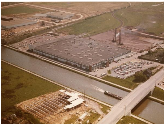
Vue aérienne de l'usine en 1969

Les extensions sont ajoutées au fil des années entre 1969 et 1977 pour agrandir considérablement les ateliers mais aussi les parkings pour stocker les voitures neuves qui jusqu'alors étaient mises en dépôt un peu partout, « sur les talus, le long de la route, jusqu'au Plateau Warocqué à Morlanwelz, même à Houdeng » 2 .