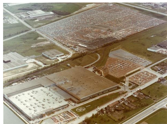
Vue aérienne de l'usine en 1977